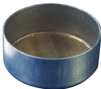
Granulatopf* ∅ innen 97 mm Höhe innen 40 mm