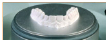
Modellscheibe* für sehr flach getrimmte Modelle.